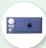
6 mm Électrode neutre N° 20140-640