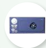
Multifonctionnel N° 20140-630 (uniquement VIO 300 D)