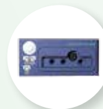
3broches-9/5 mm, monopolaire N° 20140-623