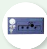
3broches-Bovie, monopolaire N° 20140-622