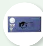
6 mm-2broches Électrode neutre N° 20140-642