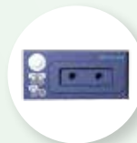
2broches-22 mm, bipolaire N° 20140-612