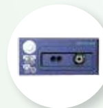
2broches-22-28-8/4 mm, bipolaire N° 20140-613