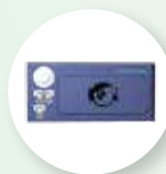
2broches Électrode neutre N° 20140-641