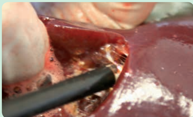
Dissection du parenchyme dans la chirurgie du foie.