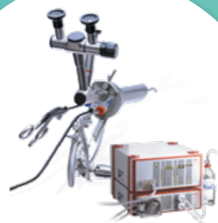
Le rectoscope rigide* pour le TEM

Single-Port-System* pour la chirurgie transanale combinant plusieurs composants réutilisables et à usage unique