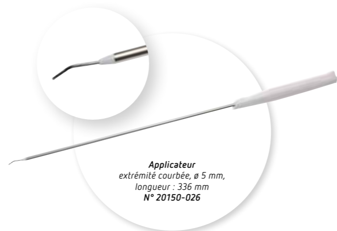
Applicateur extrémité courbée, ø 5 mm, longueur : 336 mm N° 20150-026